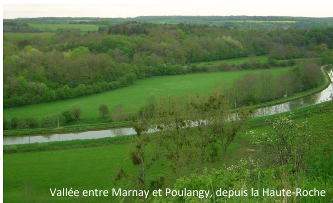
Vallée entre Marnay et Poulangy, depuis la Haute-Roche

Le site Natura 2000 des «Pelouses, rochers, bois, prairies de la vallée de la Marne à Poulangy-Marnay » englobe une vaste zone intégrant la vallée la Marne entre Marnay et Foulain, ses versants et les bords des plateaux environnant, ainsi que l'aval de la vallée de la Traire entre Poulangy et la Marne, et le ruisseau et le bois de la Combe Veutet au sud du site. Cet espace présente une mosaïque variée de milieux, du plus sec au plus humide, et selon la topographie et l'orientation de la pente, des tonalités montagnardes ou méridionales.